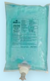
Seifenlotion mit Feuchtigkeitspflege