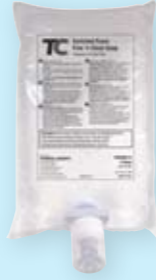
Free 'n Clean-Seife